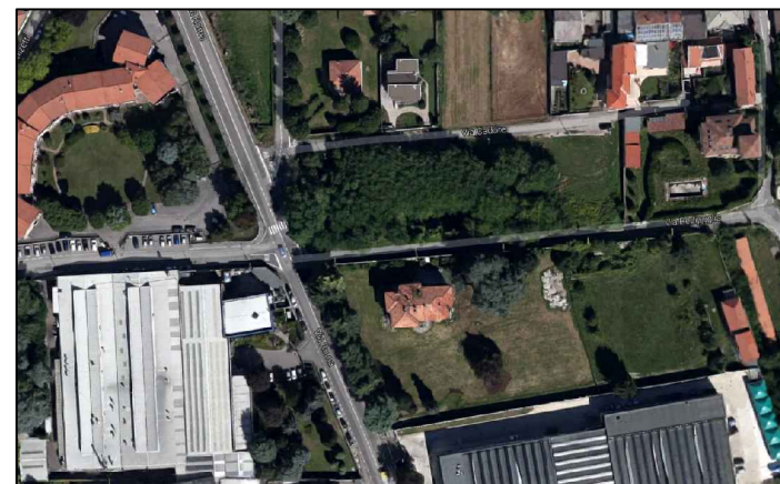
vista da Google

Dott. Arch. GIADA ALBE' Via Cavour, 39 -21050- Gorla Maggiore p.iva 03042310122 C.f. LBAGDI75H54L319Q