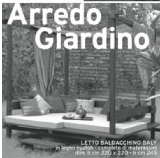
LETTO BALDACCHINO BALLY in legno nyatoh - completo di materassini dln: b cm 220 x 220 - h cm 245