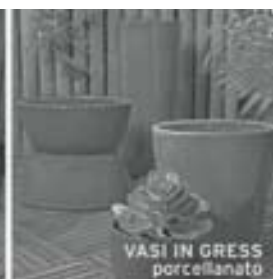
VASI IN GRESS porcellanato