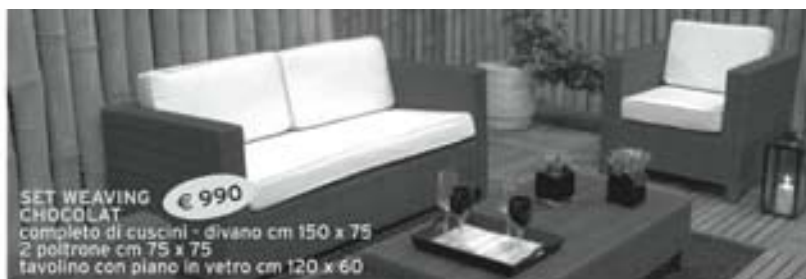
SET WEAVING CHOCOLAT € 990 completo di cuscini - divano cm 150 x 75 2 poltrone cm 75 x 75 tavolino con piano in vetro cm 120 x 60

APERTO TUTTI I GIORNI (domenica e festivi compresi) ORE 9 - 19,30 ORARIO CONTINUATO