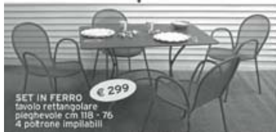
SET IN FERRO € 299 tavolo rettangolare pieghevole cm 118 - 76 4 poltrone impilabili