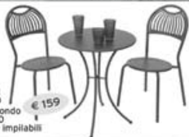
SET IN FERRO € 159 tavolo tondo e cm 60 2 sedie impilabili