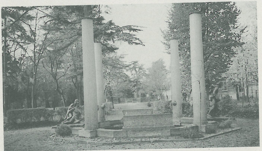
La fontana del parco è stata finalmente risistemata, anche se il clima rigido ha consigliato di sospendere presto l'erogazione dell'acqua

E' ormai in dirittura d'arrivo il piano di lottizzazione dinnanzi alla Chiesa, dopo che lo stesso ha passato attenti esami da parte della Commissione territorio e della comunità del