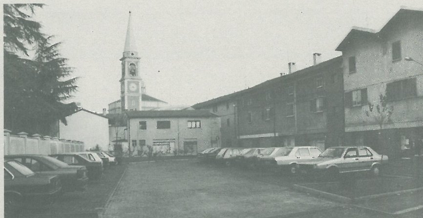
Il parcheggio realizzato in via Introzzi

- Sistemazione 2° lotto edificio ex Scuola Muratori (in attesa assegnazione mutuo Cassa depositi e prestiti)