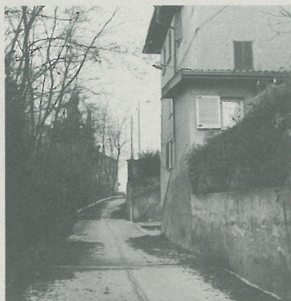
In via S. Antonio Castaiola è stata realizzata una pavimentazione in cemento

- Abbattimento barriere architettoniche plessi scolastici (approvazione piano dell'opera in Consiglio comunale)