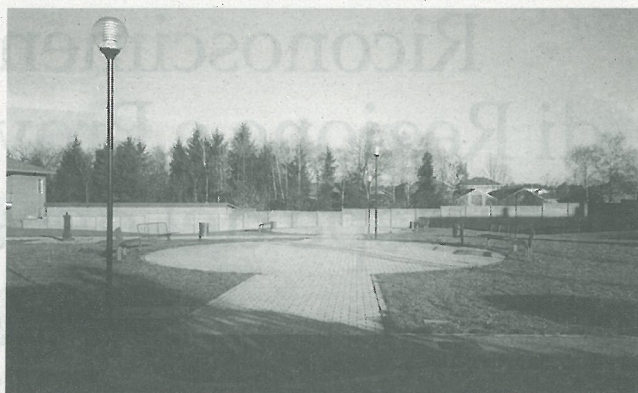
Nella foto sopra, il parco di via S. Antonio. Qui sotto quello di via Pascoli

Il risultato di questa operazione è lo sviluppo del patrimonio "verde" comunale. In tal modo lo slogan "un parco sotto casa" diventa, alla luce degli ultimi episodi, una realtà in evoluzione.