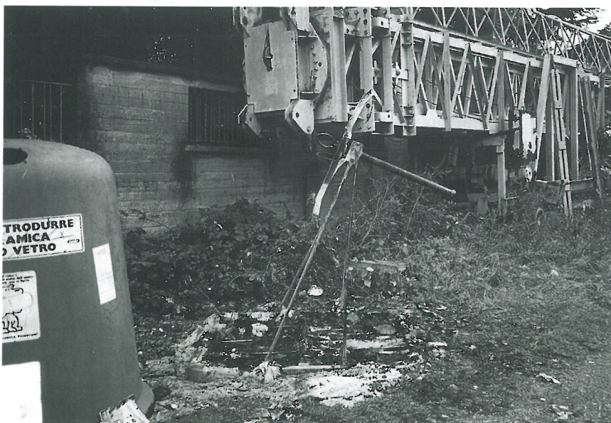
Nella foto, ciò che resta di una campana per la raccolta differenziata data alle fiamme dai "soliti ignoti"

Si ricorda che, essendo severamente vietato l'abbandono e il deposito incontrollato di rifiuti sul territorio comunale, i trasgressori sono punibili con una sanzione amministrativa da L. 200.000 a L. 1.200.000, ai sensi dell'art. 50 del Decreto Legislativo n. 22 del 5-2-97 (Decreto Ronchi).