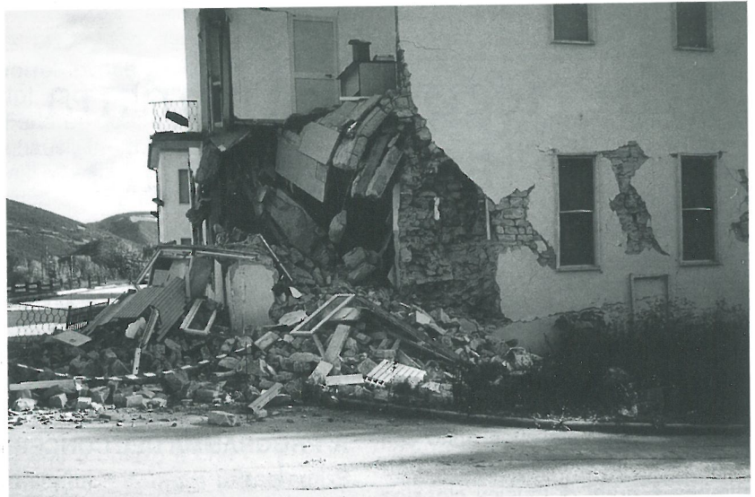
Un'immagine dei gravi danni causati dal terremoto a Nocera Umbra

L'Amministrazione comunale ha dunque stanziato 10 milioni per l'acquisto delle stufette, che sono state trasportate a Nocera Umbra con la collaborazione dell'Esselun-