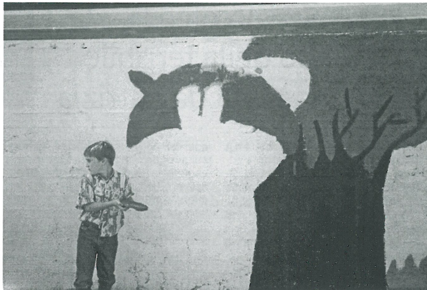
La foto seconda classificata al concorso fotografico: senza titolo, della classe 3a A della Scuola Gerbone. In basso, "Frenesia della pittura", di Elisa Raffaelli, 3a classificata

Ogni scuola ha avuto a disposizione un suo spazio: un muro, con su-