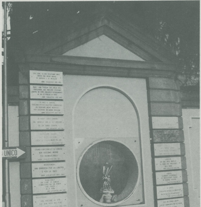
Il Monumento alla Resistenza e alla Deportazione

Anno VII - N. 1 - Marzo 1995 - Sped. in abb. post. 50% - Aut. Dir. Prov. P. T. Varese