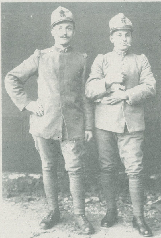
Dal 1911 al 1946 il colore delle divise dei militari italiani è stato il grigio-verde

Il racconto che viene proposto dalla mostra è volutamente più intimo, più familiare rispetto a quello dei testi di storia: non si parla di presidenti e di generali, ma di soldati, di contadini che, indossato il grigio-verde,