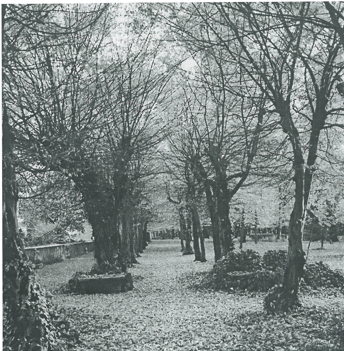
Il parco di Villa Gonzaga si veste d'autunno

ALL'INTERNO: Informazioni curiose, e non solo (pag. 3) - Accademia di musica: partono i corsi anche per i più giovani (pag. 4) - La Rassegna musicale d'autunno "apre" all'operetta (pag. 5) - Il teatro dialettale a Olgiateinsieme (pag. 5) - Per far crescere l'Archivio olgiatese (pag. 6) - Un cuore che batte per i bimbi di Kiev (pag. 7) - Il progetto "Educazione alla salute" (pag. 8) - Biblioteca (pag. 10) - Dove sono le isole ecologiche (pag. 12) - I gruppi consiliari (pag. 16) - Le Associazioni informano (pag. 19)